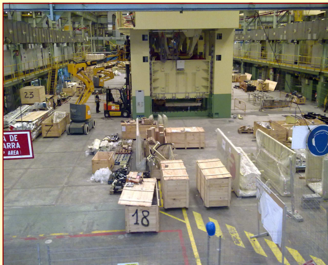
Planta de Prensas - Construcción de una nueva línea de Prensas

Con esta nueva obra conseguiremos una mayor flexibilidad y versatilidad de las instalaciones, así como una importante mejora de los puestos de trabajo.