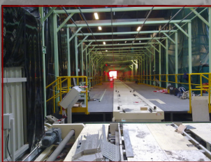
Planta de Pinturas y prechasis del Mondeo