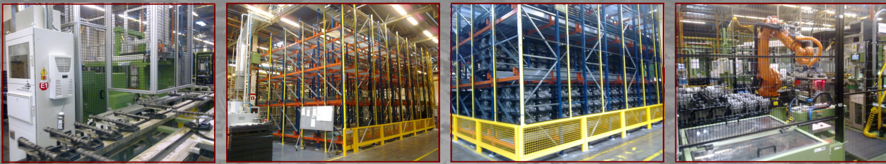
Planta de Motores: Líneas de mecanizado y montaje de motor