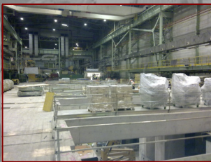
Planta de Prensas