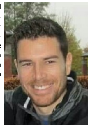
Santiago vive actualmente en Hamburgo.

más fácil poder encontrar una oportunidad de ejercer en Alemania que en España.